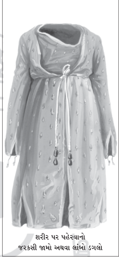
શરીર પર પહેરવાનો જરકસી જામો અથવા લાંબો ડગલો