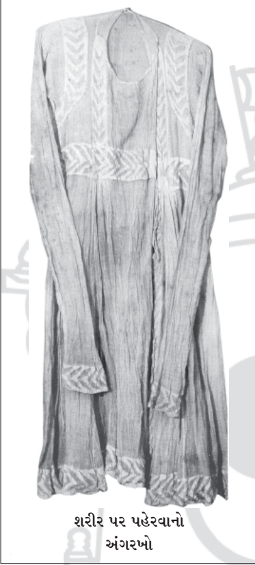
શરીર પર પહેરવાનો અંગરખો