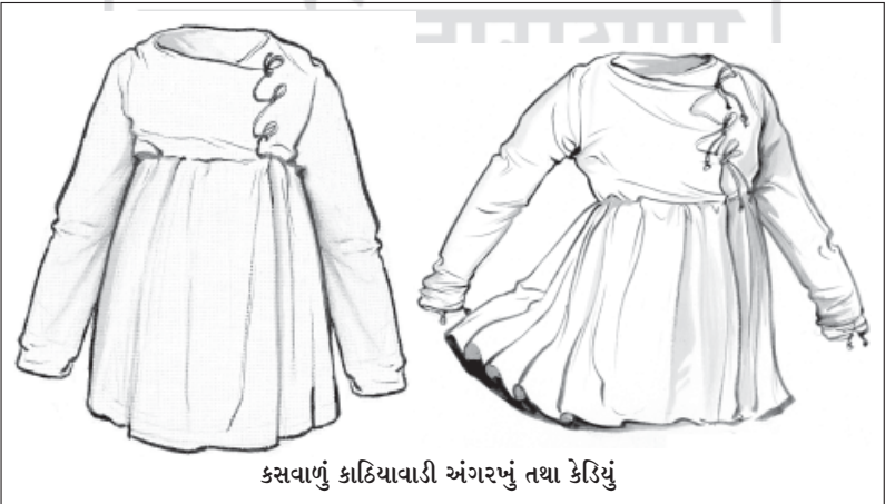
કસવાળું કાઠિયાવાડી અંગરખું તથા કેડિયું